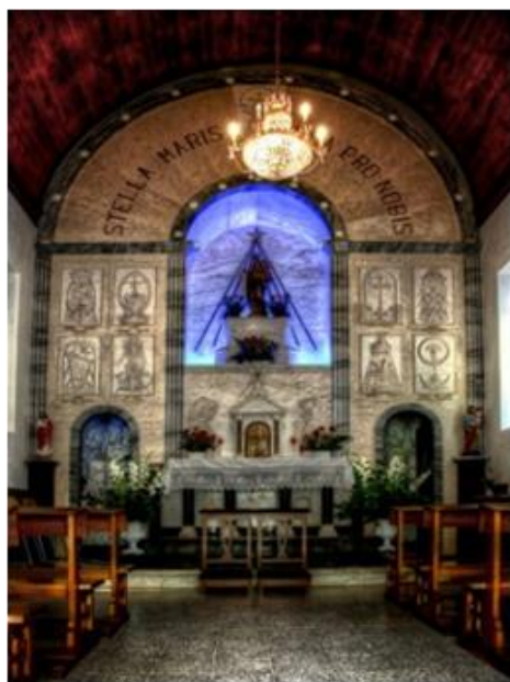
Loriga – Altar de N.ª Sr.ª da Guia