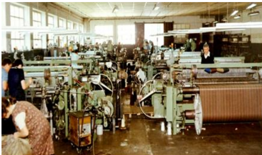
Loriga - Fábrica de Lanifícios, Moura Cabral