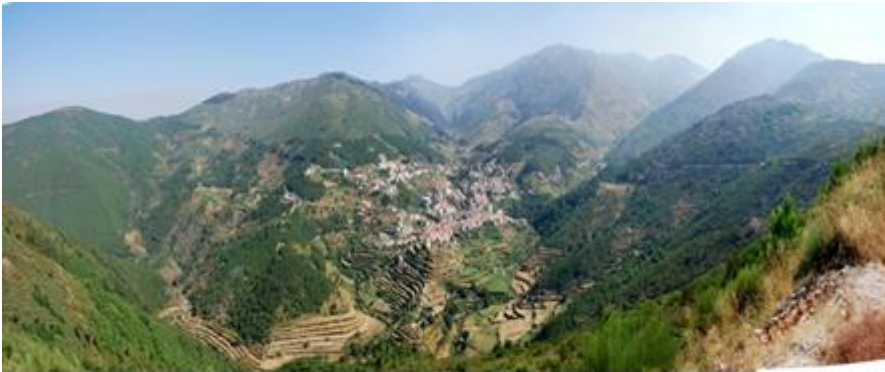
Loriga – Vista panorâmica – 2010.

Loriga é uma vila do concelho de Seia, distrito da Guarda, situada na parte sudoeste da Serra da Estrela e dista 20 km de Seia, 80 km da Guarda e 9,2 km da Lagoa Comprida. Tem uma povoação anexa o Fontão e faz parte do Parque Natural da Serra da Estrela. Está situada a cerca de 770m de altitude, é rodeada por montanhas, das quais se destacam a Penha dos Abutres (1828m de altitude) e a Penha do Gato (1771m) e duas ribeiras: a da Nave e a de São Bento que se unem formando a ribeira de Loriga. Os seus socalcos majestosos conferem-lhe uma configuração única e ímpar na região do vale glacial.