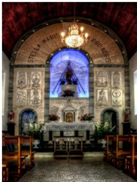
Loriga – Altar de N.ª Sr.ª da Guia